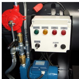
OPT-ECO-001 Sistema travaso automatico carburante. Automatic fuel transfer kit.