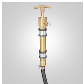
OPT-ECO-002 Pompa estrazione olio manuale. Engine oil drain pump.