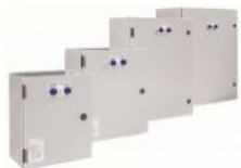
Quadro di commutazione automatica (ATS) da 800A 800A automatic transfer switch (ATS)