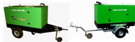
Carrelli di traino lento o veloce Slow or fast towing trailer